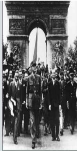
Le Général de Gaulle sur les Champs-Élysées à la Libération de Paris en 1944

De Gaulle veut restaurer la grandeur de la France. Il comprend que l'avenir 9 de la France dépend de son intégration dans une Europe forte et indépendante. Il mène 9 alors une politique marquée par la réconciliation avec l'Allemagne et une certaine distance vis-à-vis des États-Unis. De Gaulle veut aussi réformer les institutions françaises. Beaucoup de Français n'acceptent pas ses réformes et protestent en organisant de violentes manifestations en mai 1968. Peu après, de Gaulle se retire de la vie publique.